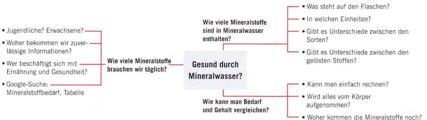
1: Strukturierung des Problems in Form einer Mind-Map

An die Diskussion der Ergebnisse, bei der herausgestellt wird, dass natürliche Wässer mehr oder weniger viel Mineralstoffe enthalten, schließt sich die Frage an, ob man tatsächlich der Werbung ( Kasten 1 ) trauen darf: Deckt der Konsum von Mineralwasser einen sehr großen Teil des Mineralstoffbedarfs eines Menschen? Die zu lösende Aufgabe kann im Ansatz gemeinsam mit den Schülerinnen und Schülern entwickelt werden. Das zunächst vage formulierte Problem lautet: